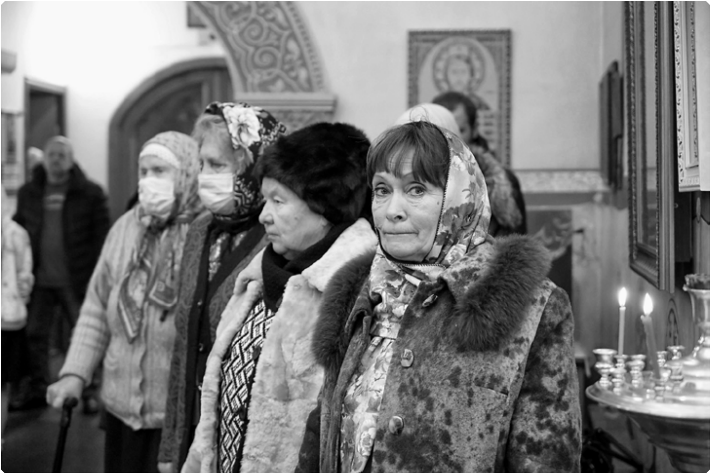
Сростинские прихожанки. Храм святой великомученицы Екатерины. Село Сростки. 7 декабря 2022 г.