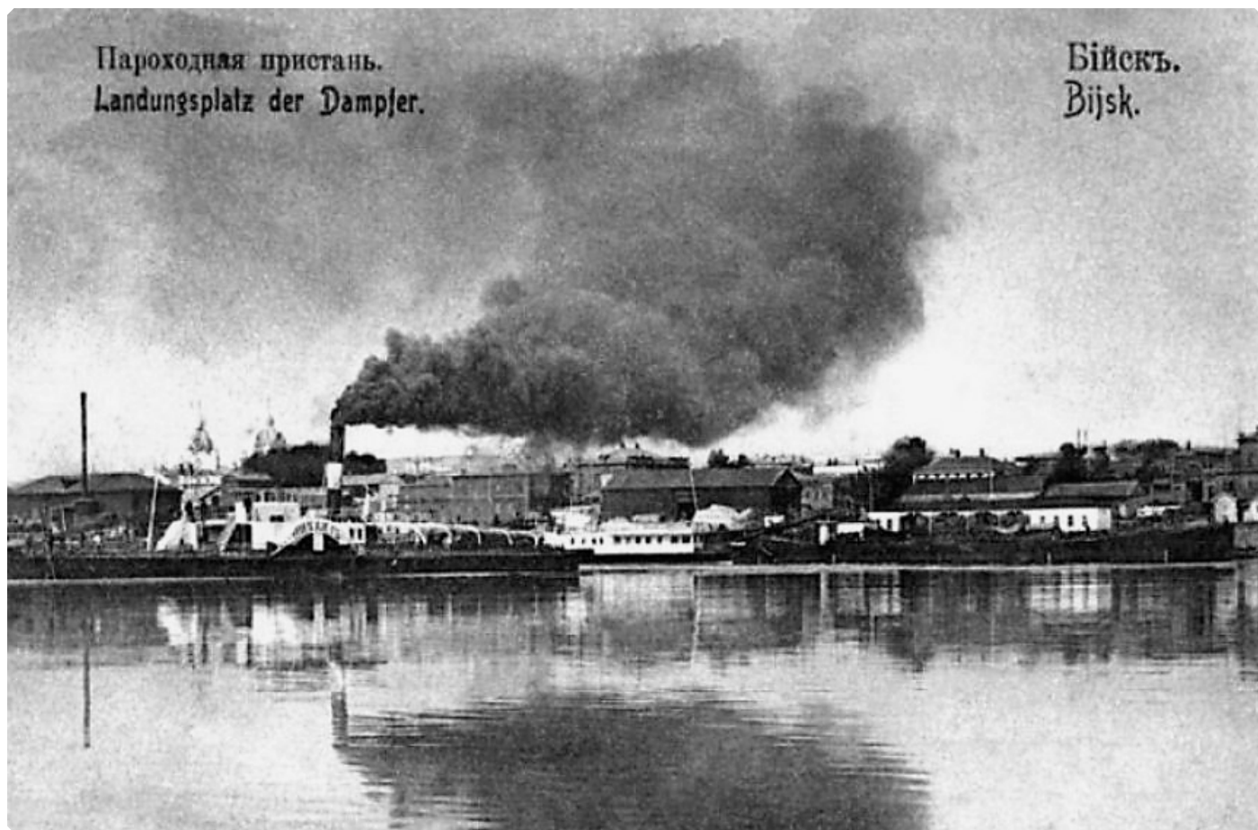
Пароходная пристань. Бийск. (Пароход «Михаил»). Почтовая карточка. Акционерное общество Гранберг в Стокгольме. Издательство Товарищества Бр. Невоструевых в Бийске. Начало XX в.