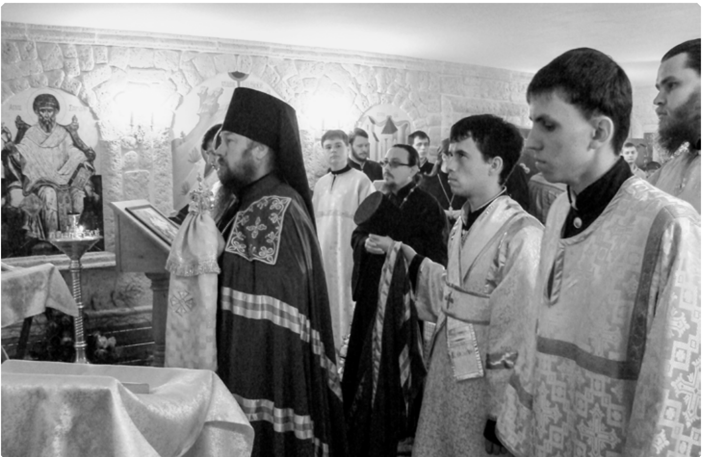
Епископ Барнаульский и Алтайский Максим (Дмитриев) совершает освящение нижнего придела в честь святителя Спиридона, епископа Тримифунтского. Село Сростки. 4 июля 2009 г.