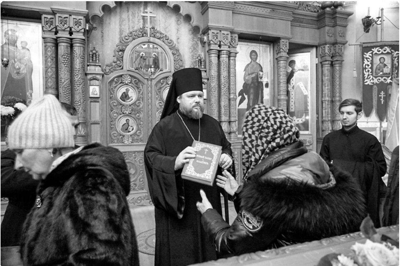
Подарки от владыки Серафима. Храм святой великомученицы Екатерины. Село Сростки. 7 декабря 2022 г.