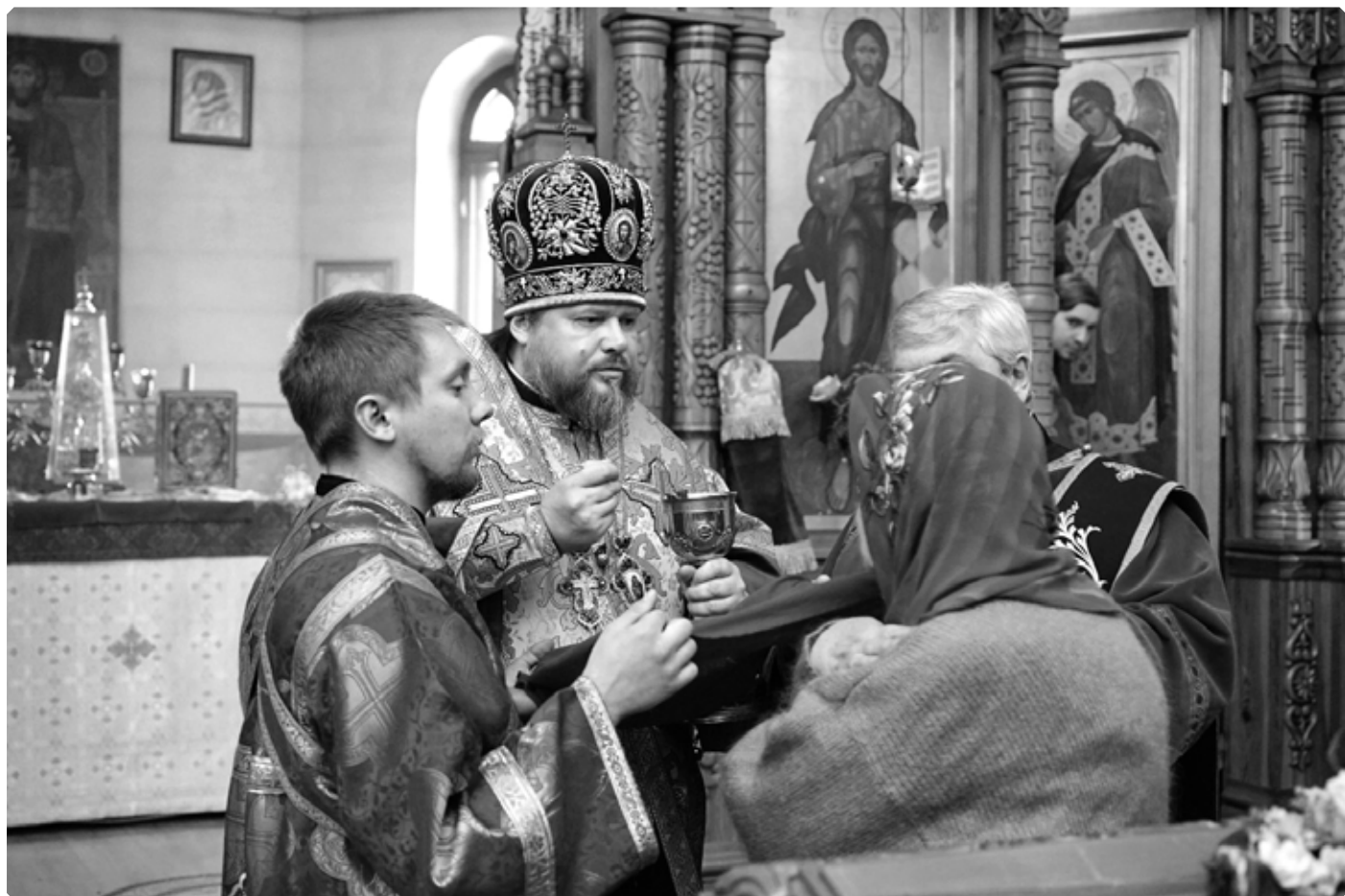
Преосвященный Серафим, епископ Бийский и Белокурихинский, преподает Святые Тайны. Храм великомученицы Екатерины. Село Сростки. 7 декабря 2022 г.