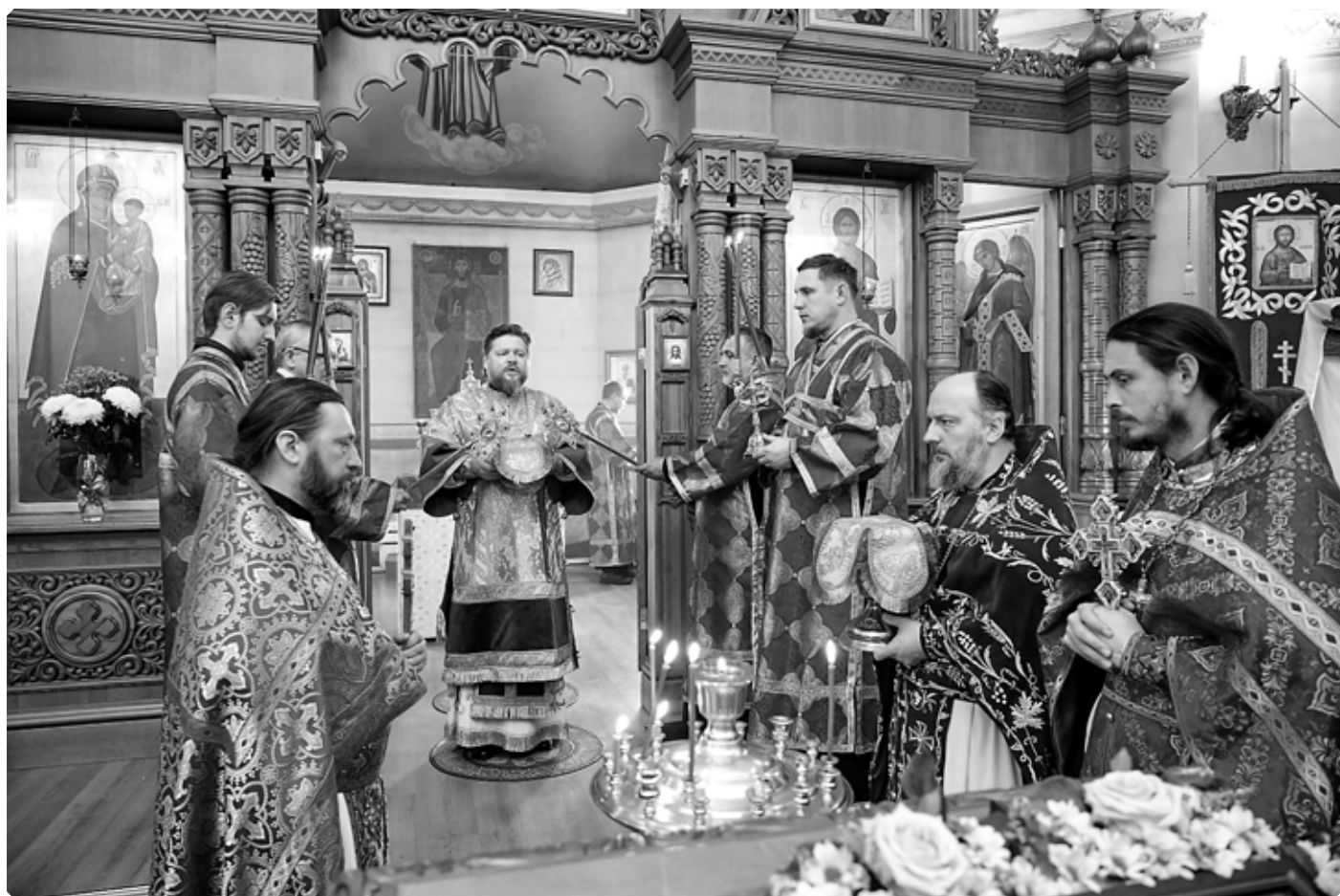
Правящий архиерей и сослужащее ему духовенство Бийской епархии. Село Сростки. 7 декабря 2022 г.