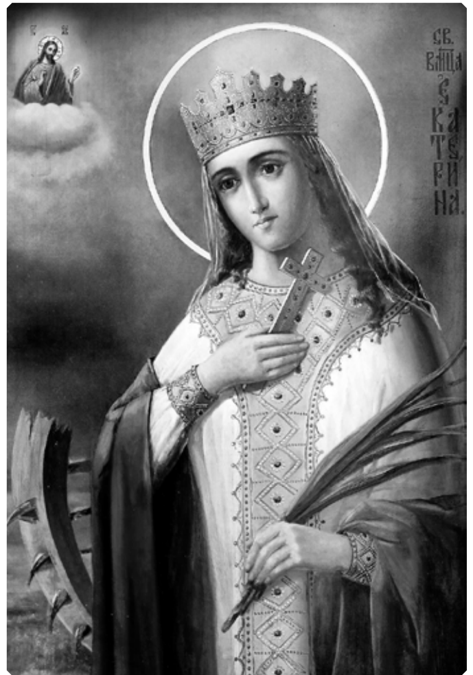
Святая великомученица Екатерина Александрийская

Однажды, вспоминая на проповеди житие великомученицы, митрополит Антоний Сурожский сказал: «Она была молоденькой девушкой, когда ей пришлось предстать перед несправедным человеческим судом. Преданная отцом-язычником за веру во Христа, оставленная родными, Екатерина одна стояла перед судьей, от которого не ожидала милости. Окруженная толпой, она не видела от нее ничего, кроме враждебности. И лютая ненависть обрушилась на нее. Как обрушится на всех нас, верующих во Христа, потому что мы, как юная, хрупкая, но несокрушимая Екатерина, верим в одного Господа, в одного Царя, поклоняемся одному Богу. Мы не должны поклониться тем идолам, которые воздвигаются вокруг нас сегодня, а должны быть готовы к повторению подвига святой великомученицы. Давайте же научимся от непобедимой Екатерины жить без страха в страшном мире, без страха ожидать всего, что может случиться, и бояться только одного: как бы в наших сердцах не потускнела вера, как бы в наших сердцах не стала вымирать любовь, как бы мы не перестали быть верными до конца. В терпении