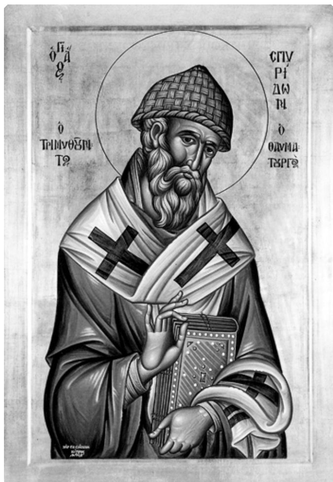
Святитель Спиридон, епископ Тримифунтский

храма в Сростках: верхний его придел было решено посвятить святой Екатерине Александрийской, а нижний – святителю Спиридону.