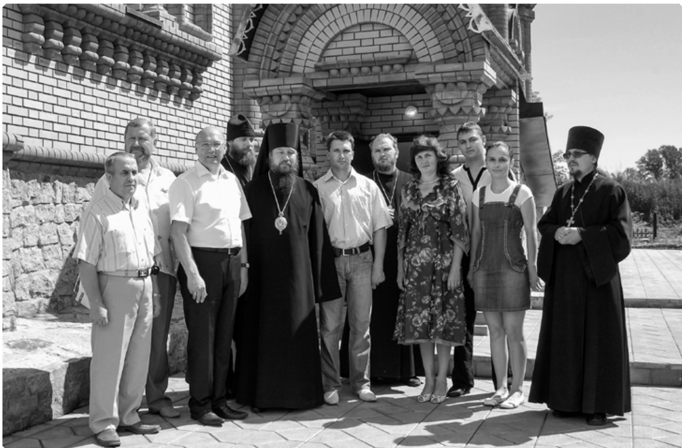
Духовенство и строители храма после освящения верхнего придела в честь великомученицы Екатерины. Село Сростки. 11 июля 2009 г. ВММЗ В.М. Шукина