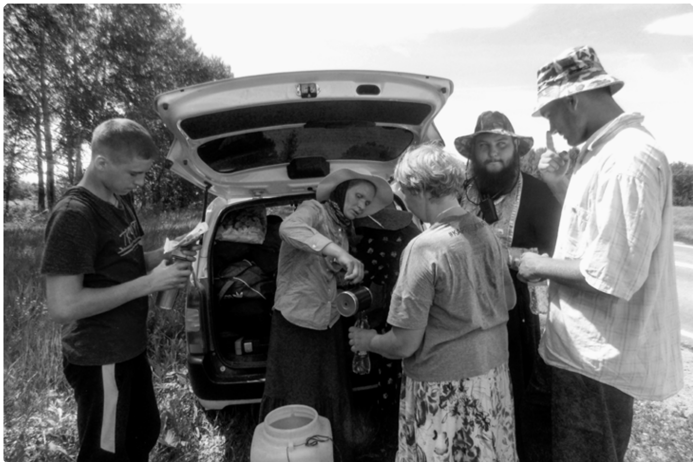
На пути в Ануйское. 26 июня 2022 г.