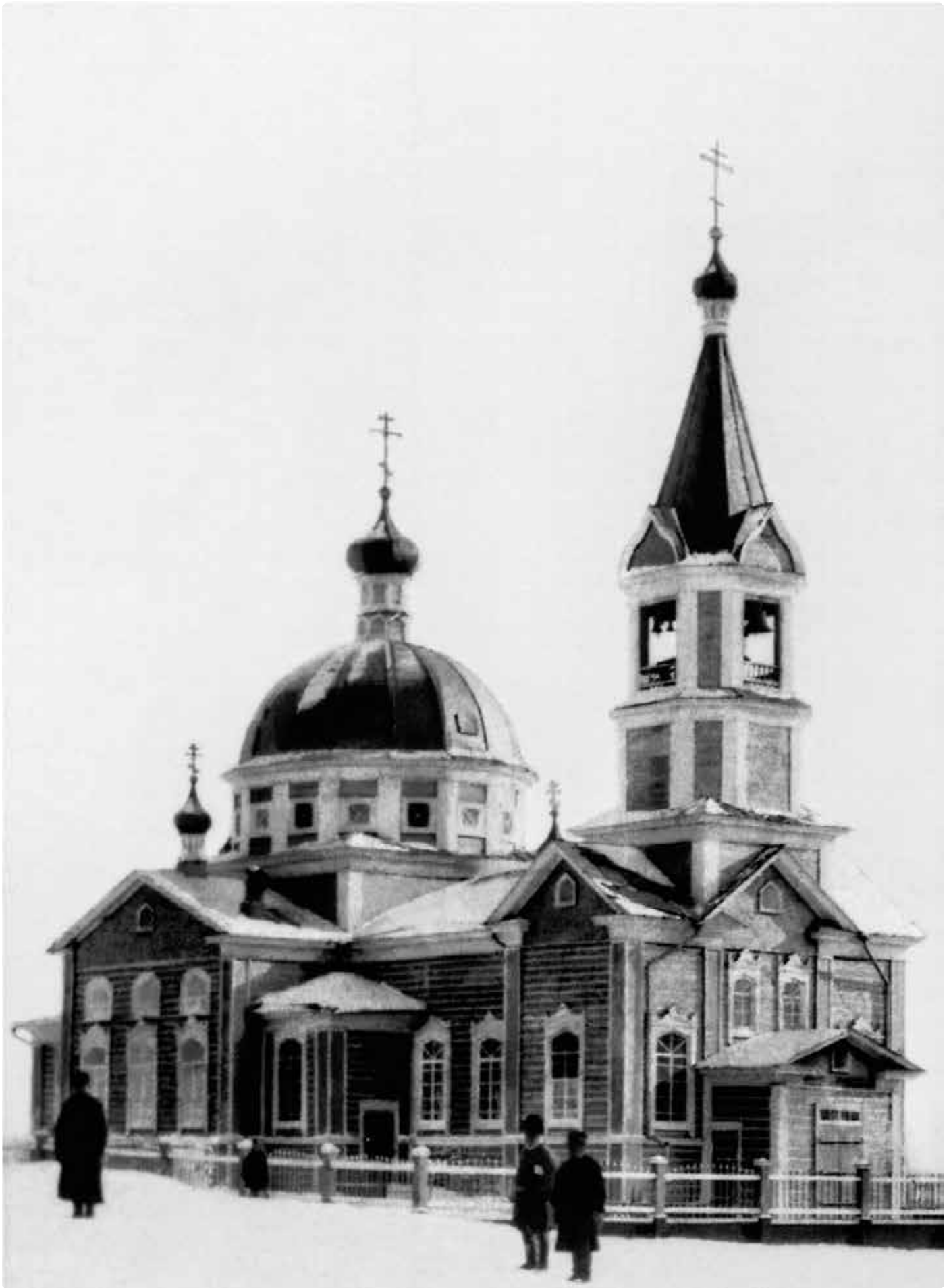
Храм во имя Живоначальной Троицы, освященный 17 ноября 1902 года. Село Сростинское. 1910 год.