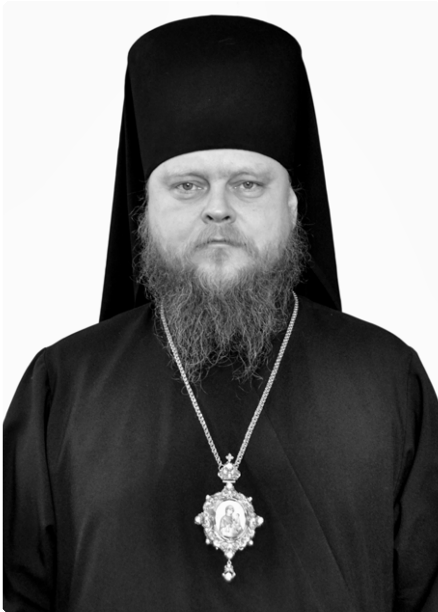
Преосвященный Роман, епископ Рубцовский и Алейский

Поздравление Преосвященного Серафима, епископа Бийского и Белокурихинского, Преосвященному Роману, епископу Рубцовскому и Алейскому, с 50-летием со дня рождения